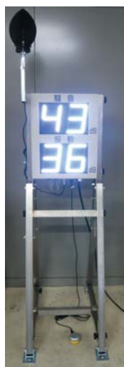
<スタンド設置の場合> 折りたたみ式で一人で簡単に組み立てできます