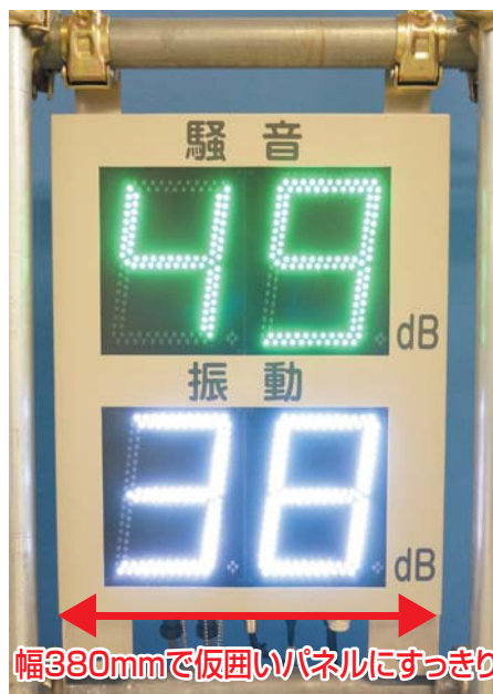
幅380mmで仮囲いパネルにすっきり