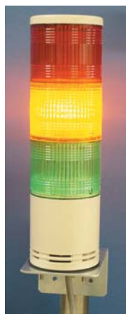
<LED表示灯> (オプション) 警報値は本体の設定パネルで設定可能です